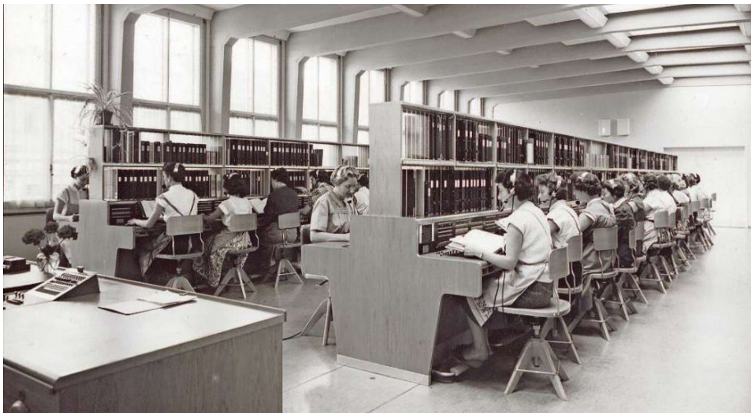
Tar la savida generala e la buna vusch da las telefonistas tutgava er il code da gardaroba cun rassa e scussal.